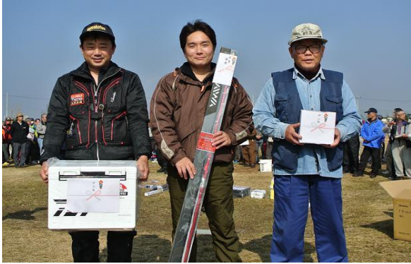
本賞の部、上位3名の皆さま はい、チーズ！