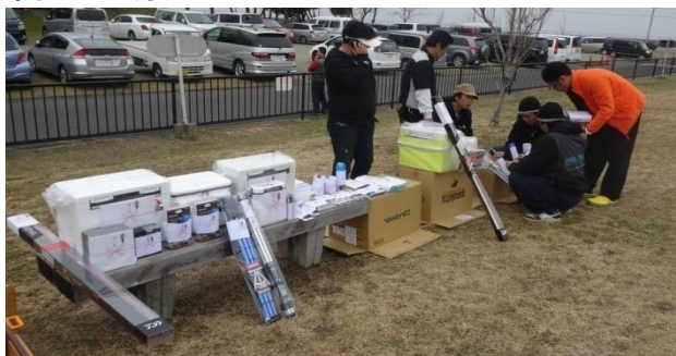
準備されている賞品