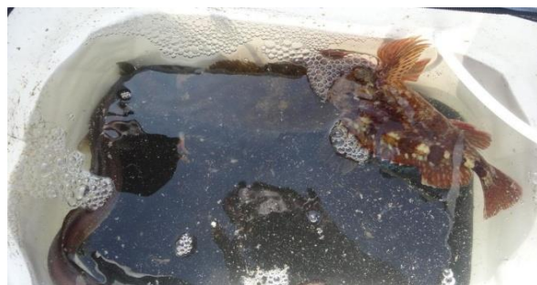
これが噂の活け魚宅急便