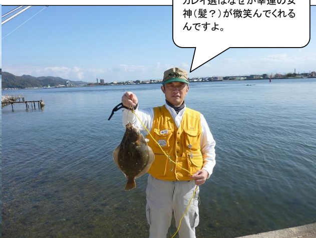
カレイ選はなぜか幸運の女神(髪?)が微笑んでくれるんですよ。