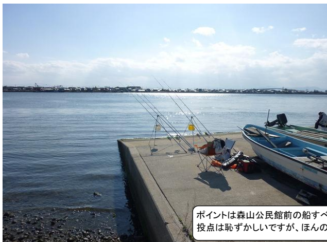
ポイントは森山公民館前の船すべりです。 投点は恥ずかしいですが、ほんの数メートル先(超近投)でした。