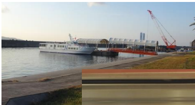
土生港から沼島行きの船が出ています。釣りに行きませんか ↓ 発着時間表