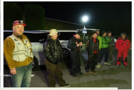
23時、参加者(1名欠席)全員集合、昨日まで荒れ模様の天気でしたが、この日は風も無く、絶好の釣り日和