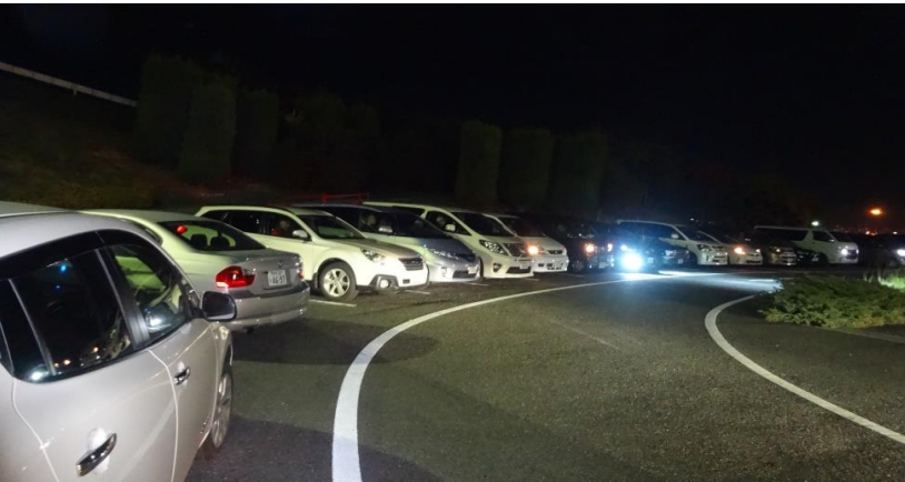
各車整列、皆さんお行儀がイイですわ。