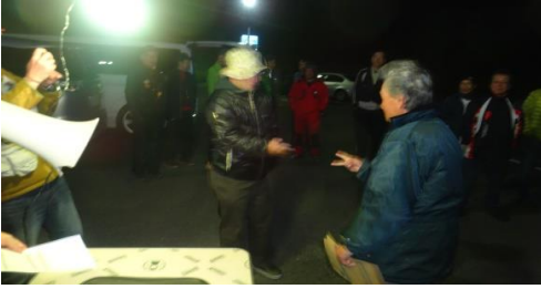
出発順の抽選開始。クジに一喜一憂？