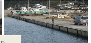
キスを求めて土生、湊、郡家と探りましたが、この日はサッパリでした。