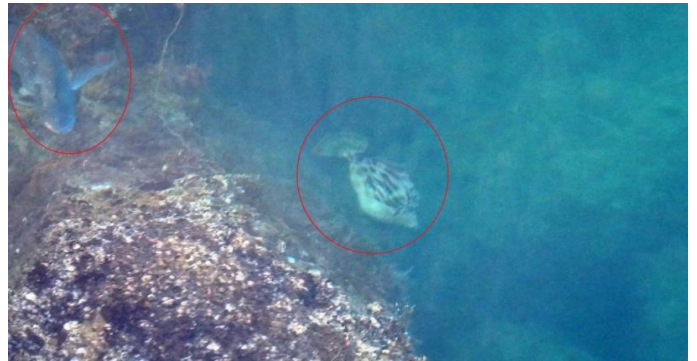
土生漁港で大型のクロダイ2尾、さらにカワハギ（大きい！）が見えました。