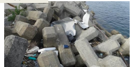
★ゴミがゴミを呼んでこの有様