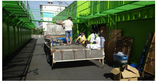
最後に協会倉庫へ各資材を降ろして終了、お手伝いの皆様、本当にお疲れ様でした。