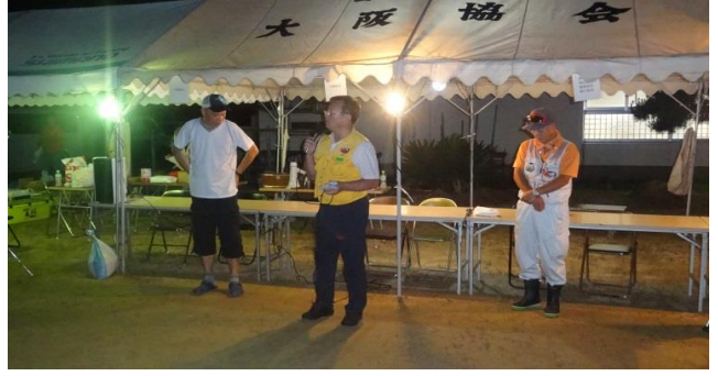
池田大阪協会長のご挨拶