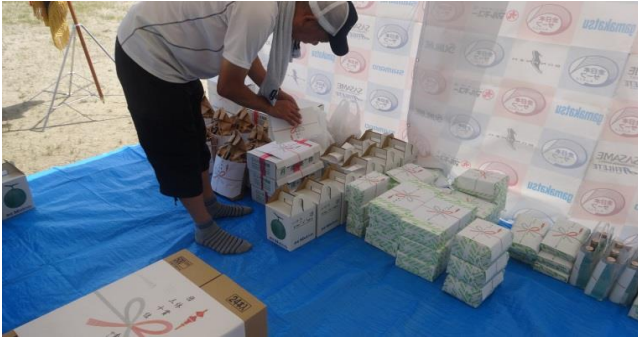
賞品の準備もたいへんです。