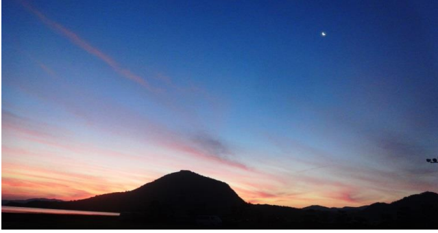
午前4時半、朝焼けの空に半月がクッキリと輝く。