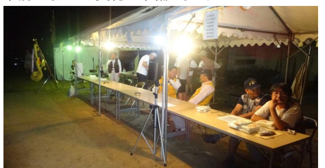
受付準備を完了しました。