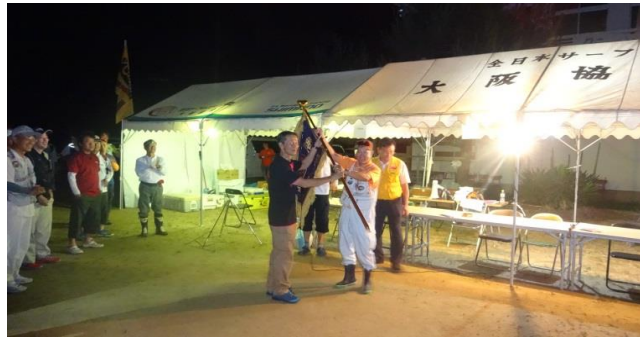
昨年の優勝チームから優勝旗返還