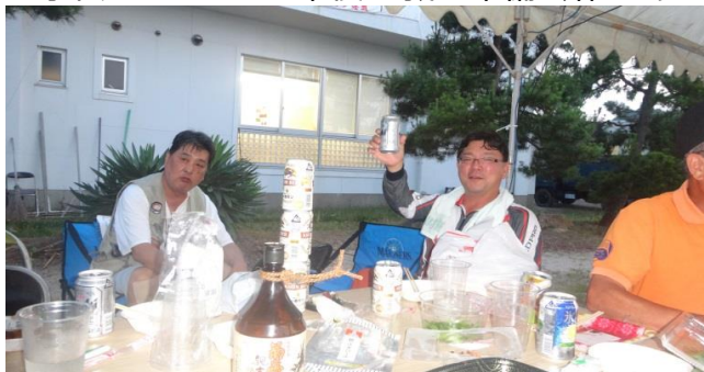
準備完了後は冷たいビールで乾杯！