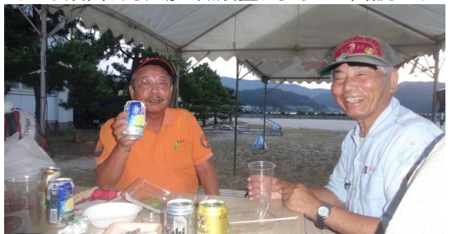
他協会の方もご一緒に乾杯！