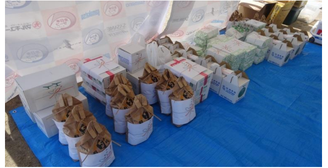
数、内容をチェック