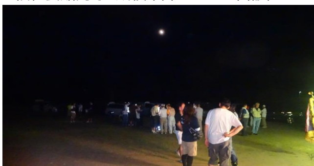
各協会の皆さんも受付前に集まります。