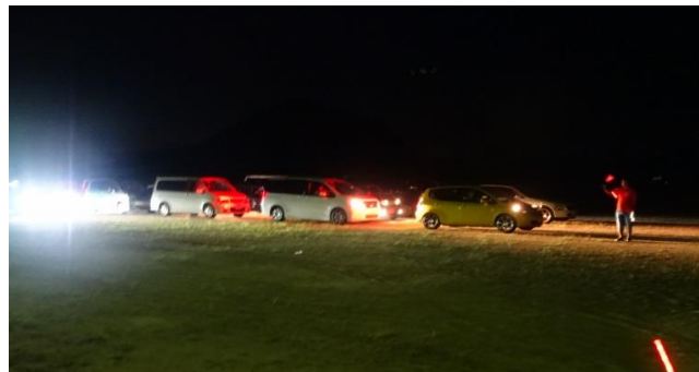
3時半、釣り場へ各車スタート