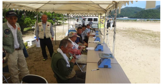
10時、審査準備も完了しました。