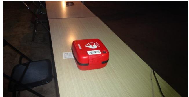
もしもの時にA E Dも準備しました。