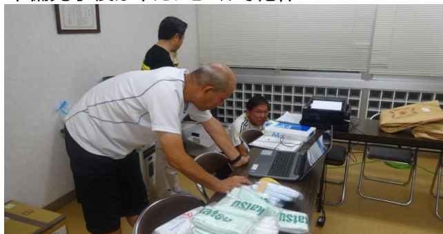
福社会館内では成績集計のPCを準備中