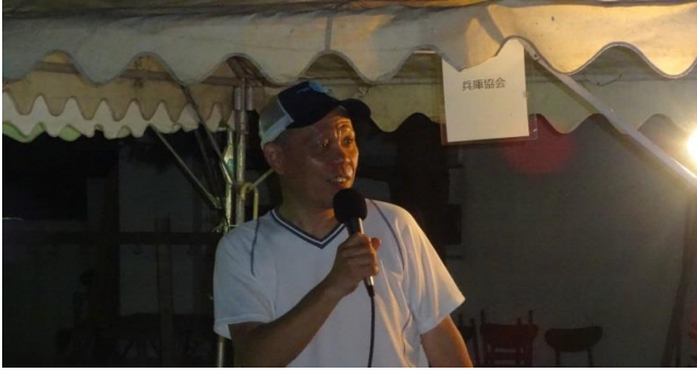
司会役の大阪協会上野事務局長