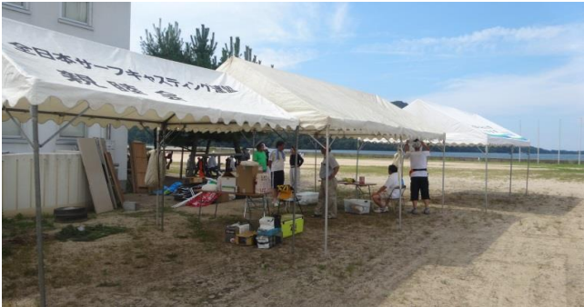
お手伝いのメンバーは午後2時から準備を始めます。