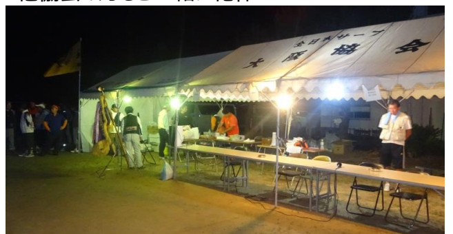
午前2時過ぎ、受付の準備をします。