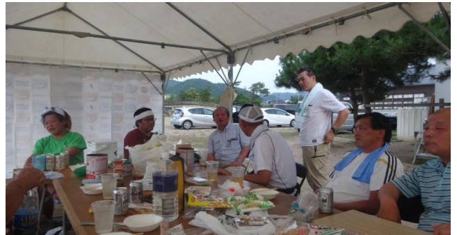
テント設営、釣り場の幟設置、氷などを準備します。