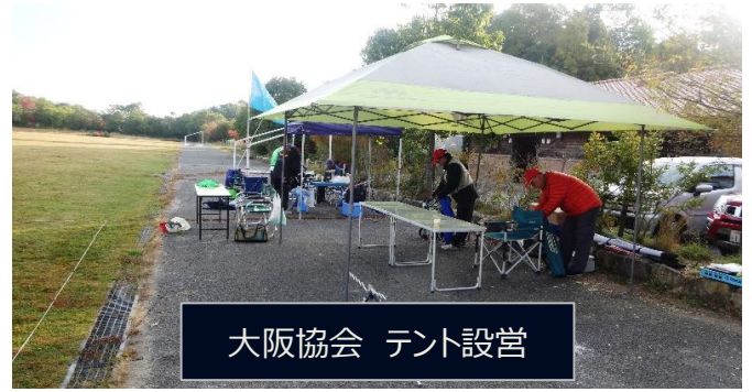
大阪協会 テント設営