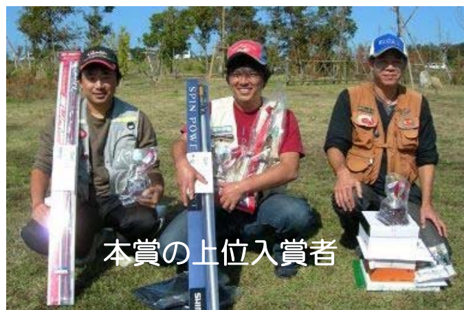
本賞の上位入賞者