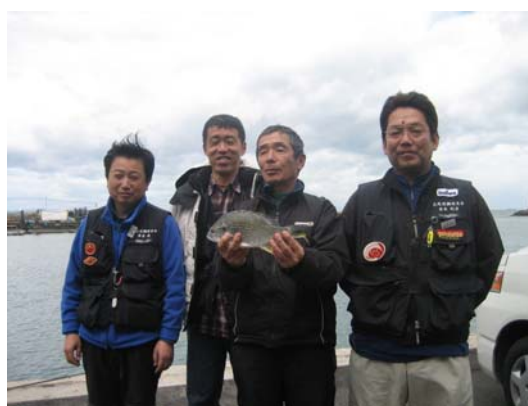
銀鱗投友会の皆様です