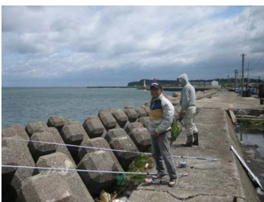
釣れたかな・・・？