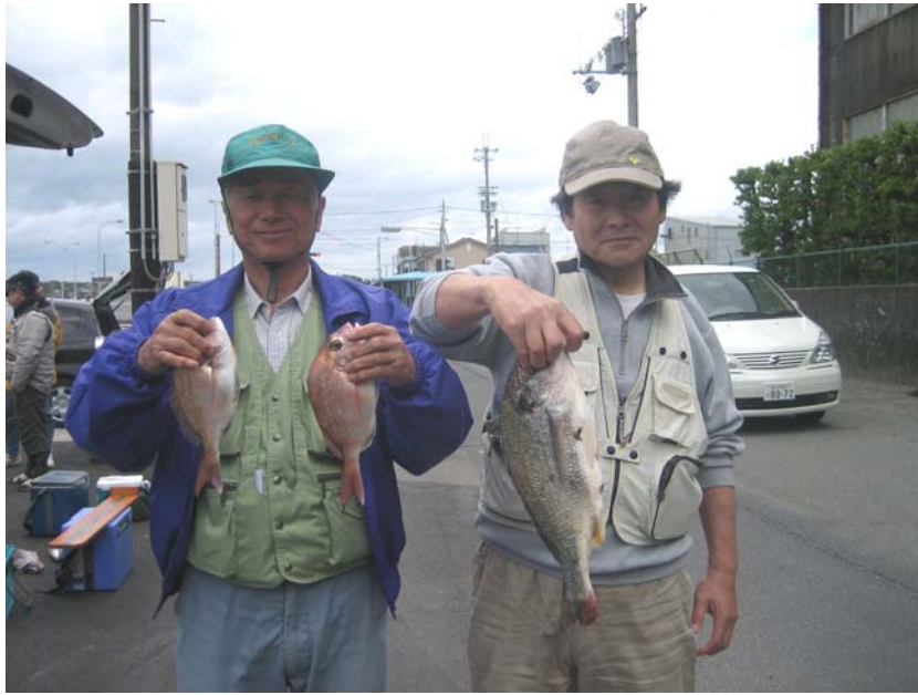
高石サーフ様です

当日は日本海方面では、明け方より強風波朗警報が出るような荒天でしたがさすが大阪協会員のつわものの皆様審査にはしっかりお魚をそろえて提出されたようです。結果は成績表でご確認下さい。