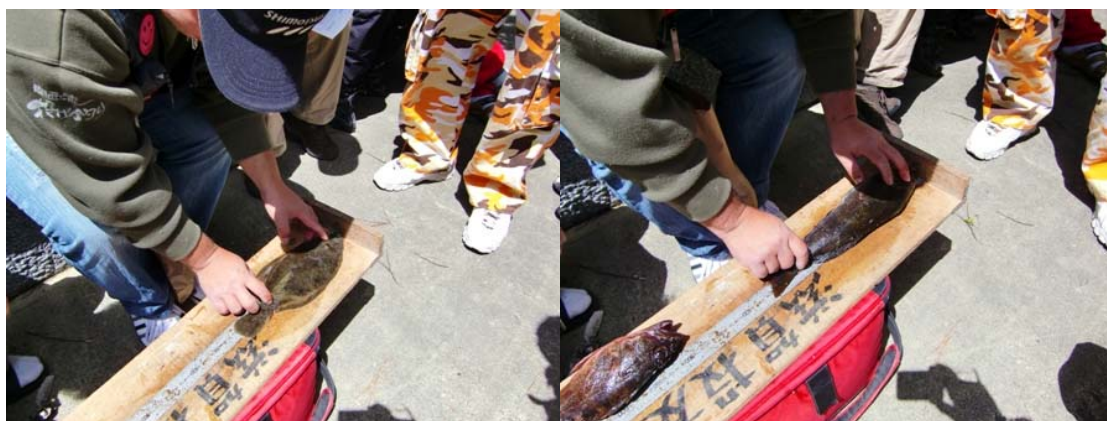
続きましては泉南会場です