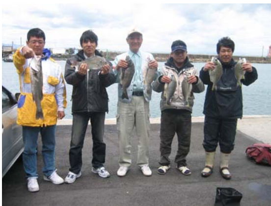
貝塚サーフの皆さん