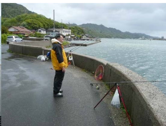
なにわキャストーズの桑ちゃん