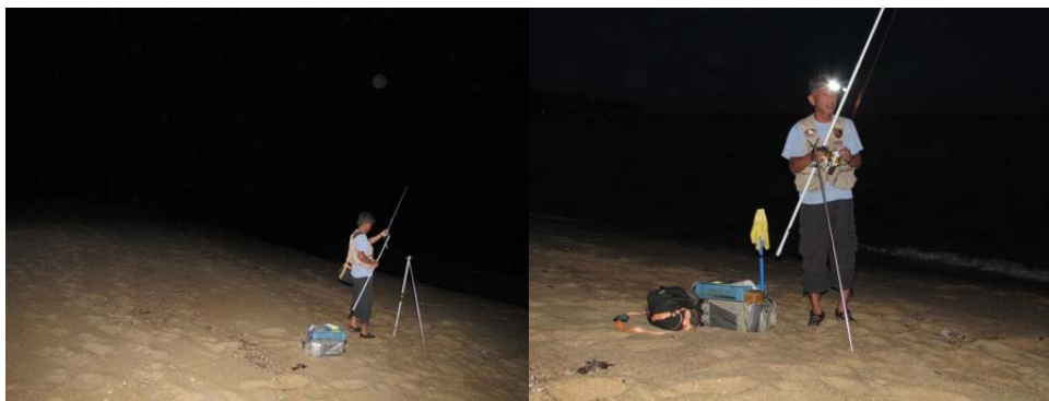
釣り場に到着するもなお暗くキャップライトを頼りに仕掛けを準備中