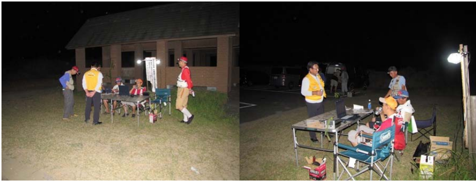
早朝より受付の準備です照明も持参し準備万端！

8月最終日曜日になれば日中の暑さも少しはましになるかと考え日程を組みましたが今年は観測史上最高気温の8月を記録した年だけに当日も日の出直後より強烈な日差しに見舞われ暑さとの格闘の1日となりました。