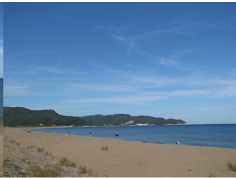
以上釣り場でのスナップです（魚が写っておりませんが・・・）