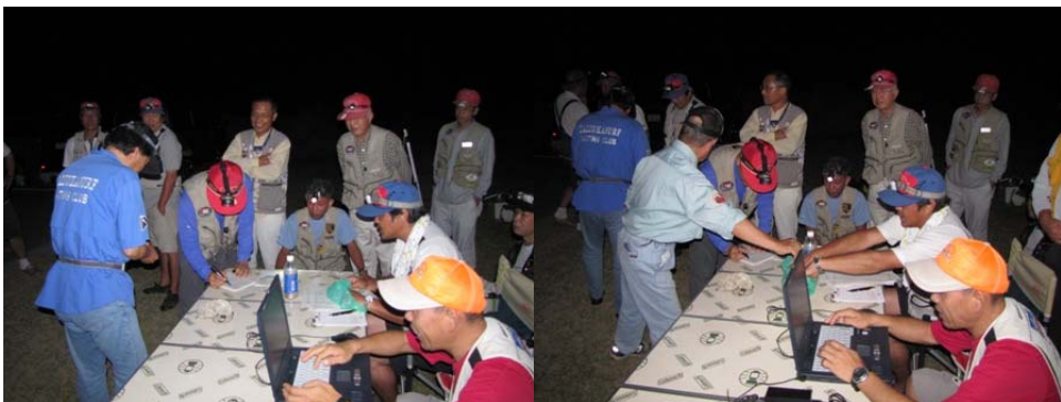
クラブ混合キスとの名のように抽選にて当日団体チームを決定いたします。