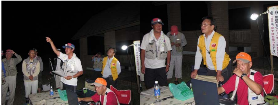
池田協会長並びに伊達競技委員長より挨拶並びに競技事項説明です。